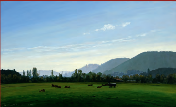
„Vor den Toren der Stadt“, 2026, Öl auf Hartfaser, 27 x 45 cm